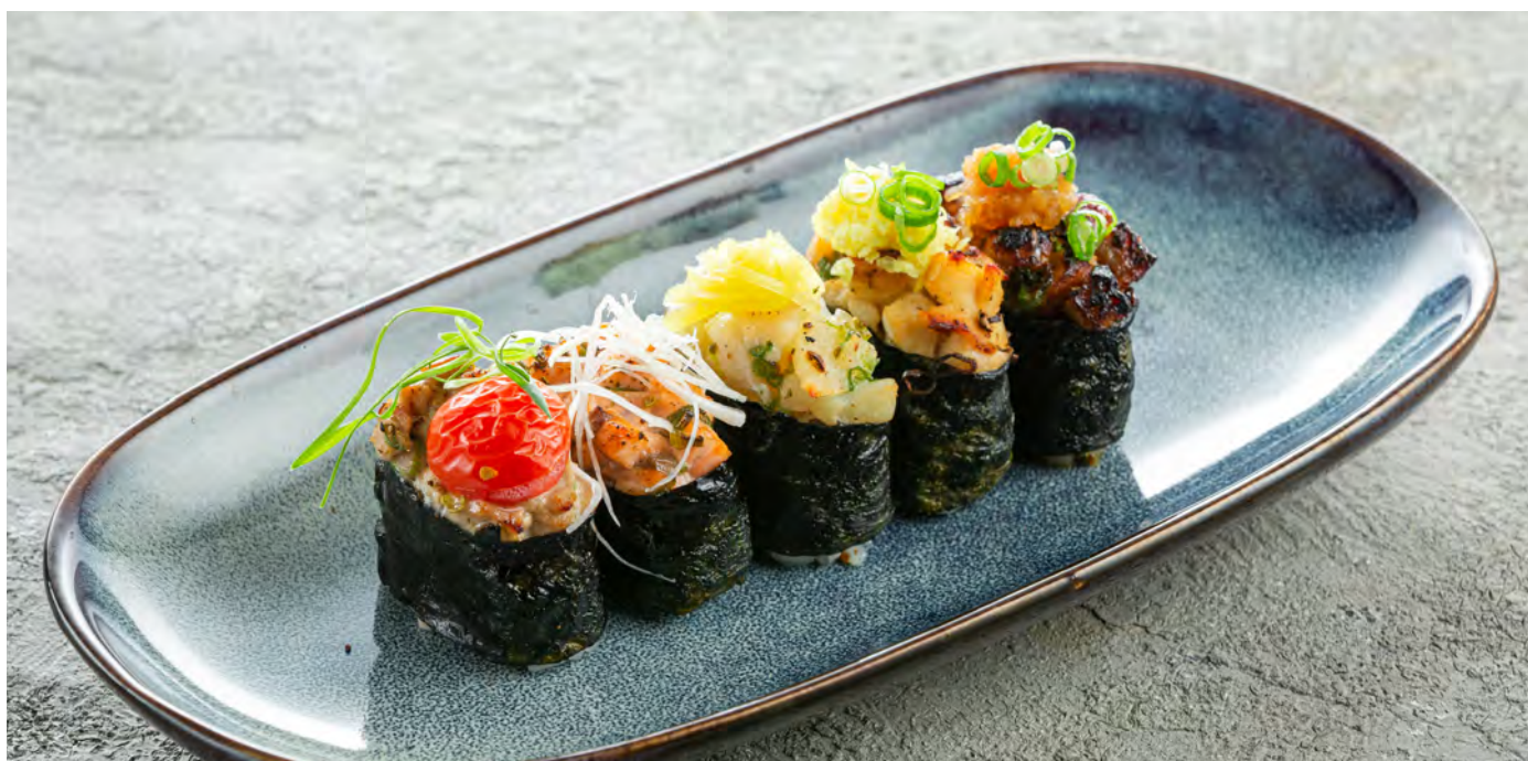
Сет суши запеченные New Style