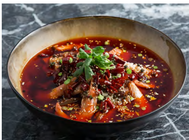
Маосюэван 毛血旺 / Mao Xue Wang ..... 1090,00