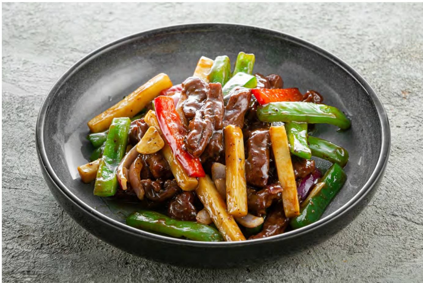
Стир-фрай из мраморной говядины в перечном соусе с побегами бамбука 黑椒牛柳 / Black Pepper Marbled Beef Stir-Fry ..... 880,00