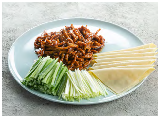
Свинина по-пекински 京酱肉丝 / Peking Sauce Pork ..... 530,00