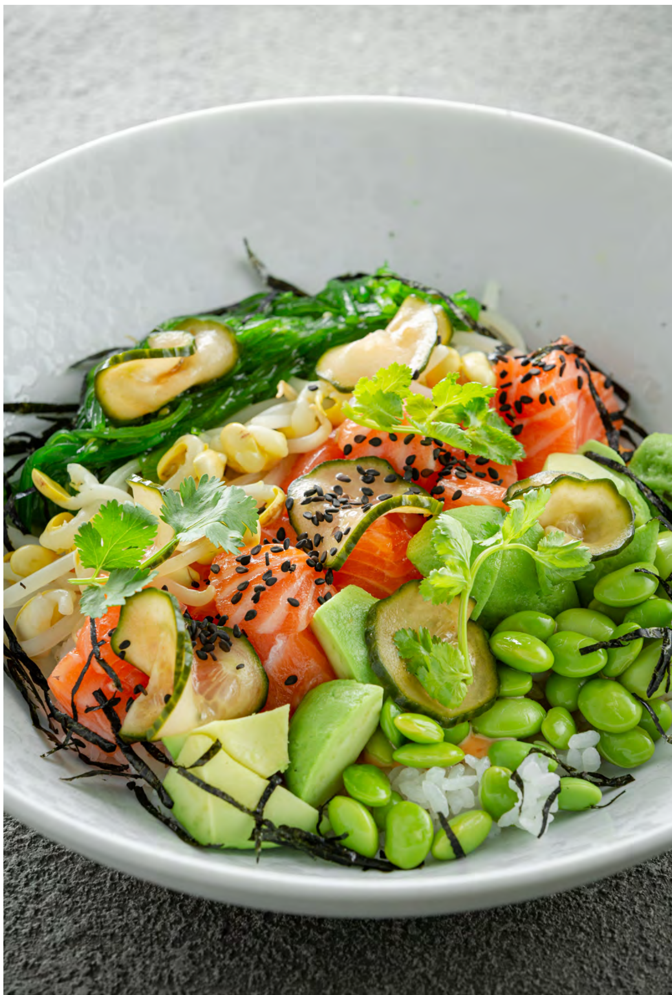
Поке с лососем, авокадо и чукой