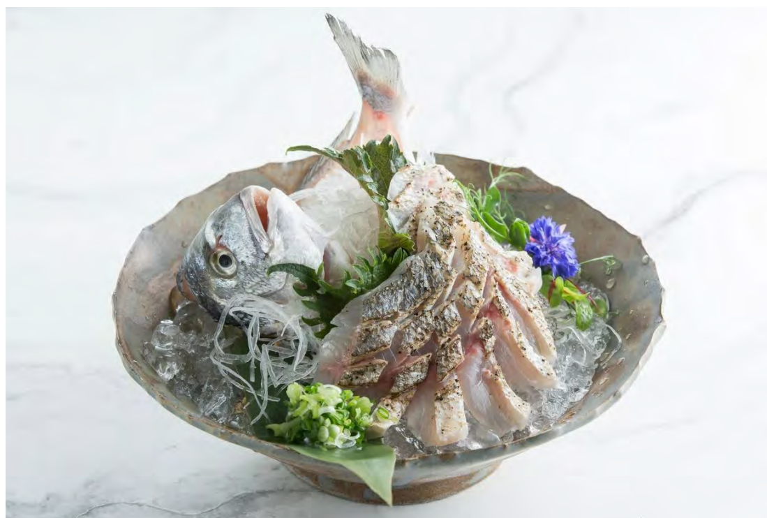
Сашими дорадо 金头鲷刺身 / Dorado Sashimi ..... 980,00