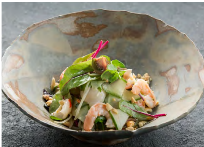
Малазийский салат с креветками и личи 马来西亚荔枝鲜虾沙拉 / Malaysian Shrimp and Lychee Salad ..... 650,00