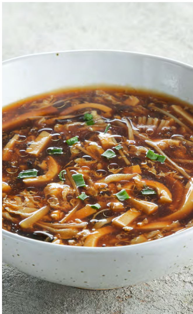
Кисло-острый суп 酸辣汤 / Hot and Sour Soup ..... 420,00