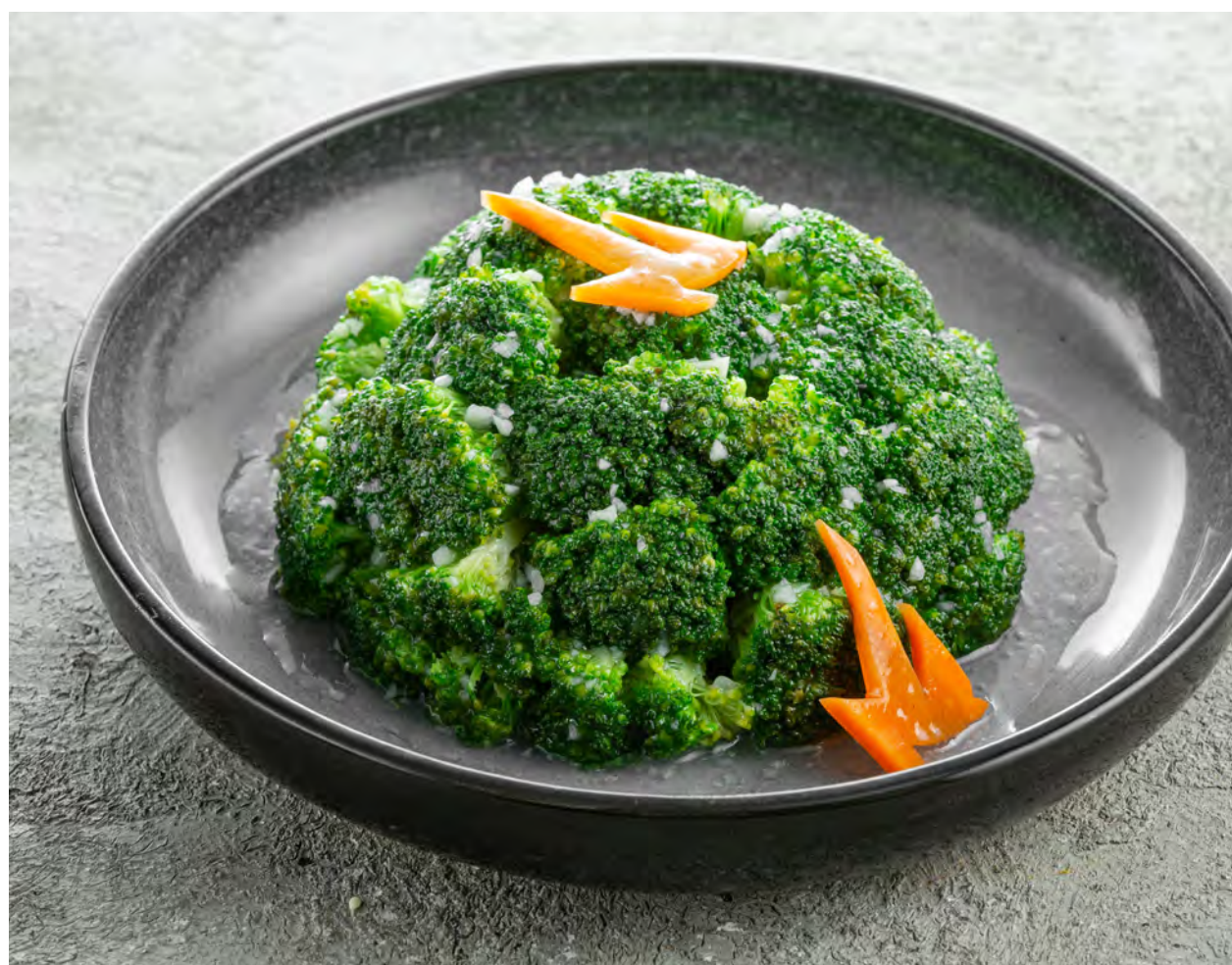
Брокколи с чесноком