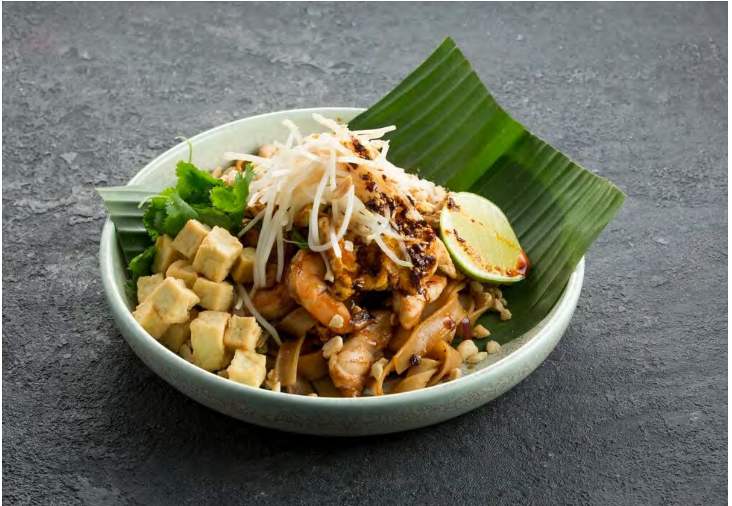
Лапша Пад-Тай с цыпленком и креветками 泰式鲜虾鸡肉炒粉 / Pad-Thai with Chicken and Shrimp ..... 540,00