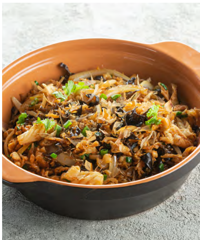
Стир-фрай из фунчозы с кальмаром и креветками 海鲜桂花炒粉丝 / Squid and Shrimp Glass Noodles Stir-Fry..... 530,00