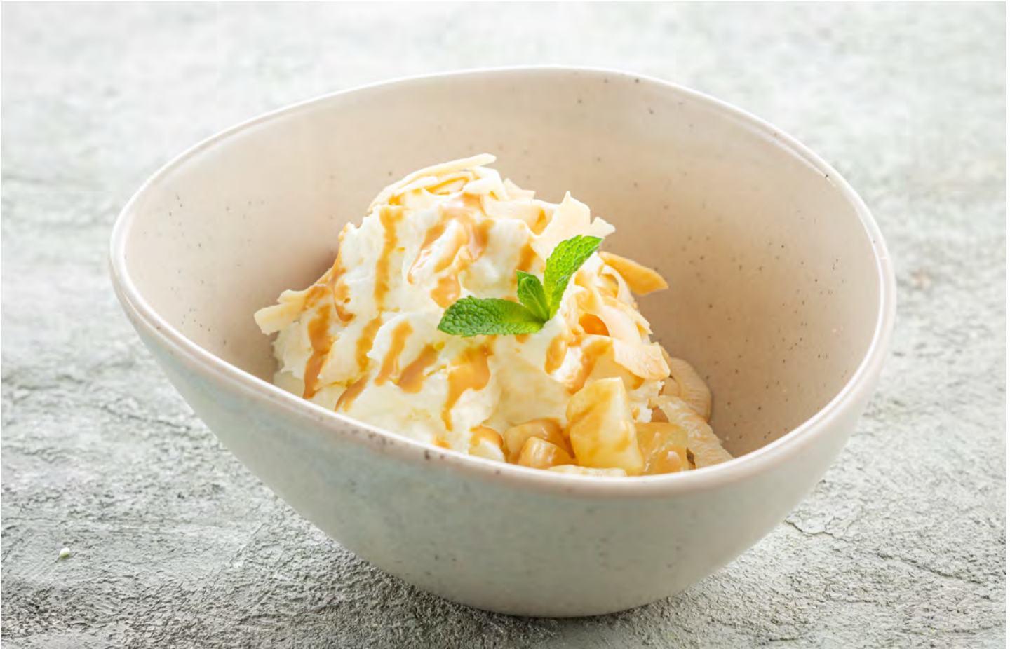
Кокосовый мусс с пряной грушей