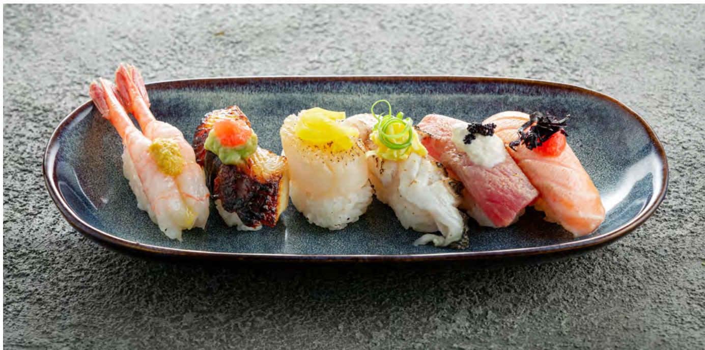
Сет суши New Style