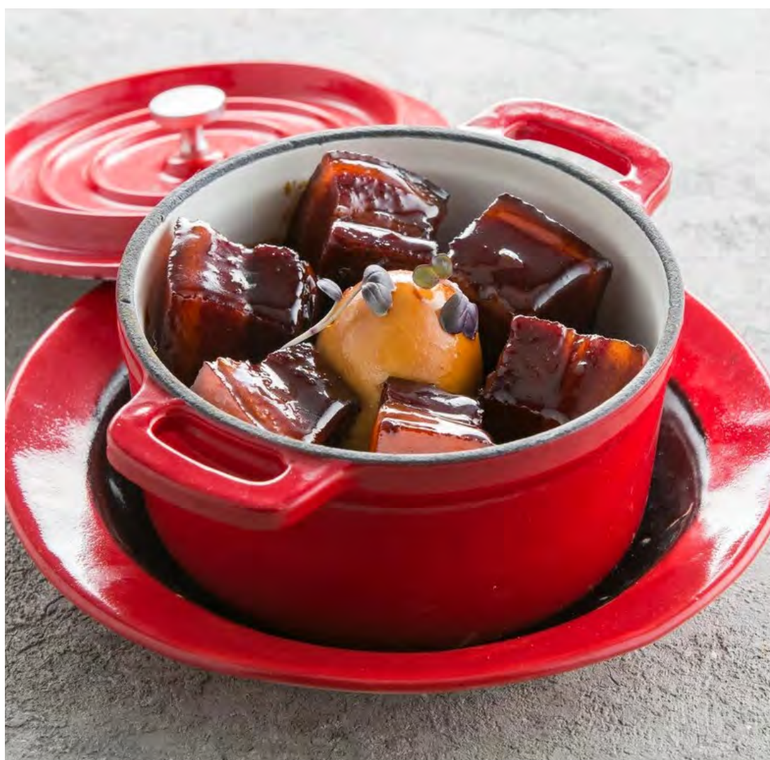
Свиная грудинка в соусе "Хуншао" 妈妈红烧肉 / Hongshao Braised Pork Belly