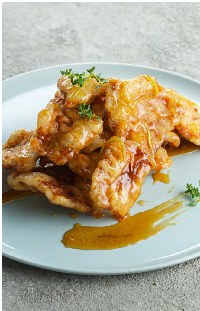
Свинина "Гобаожу" в кляре под кисло-сладким соусом 锅包肉 / Guo Bao Rou Crispy Sweet and Sour Pork..... 500,00