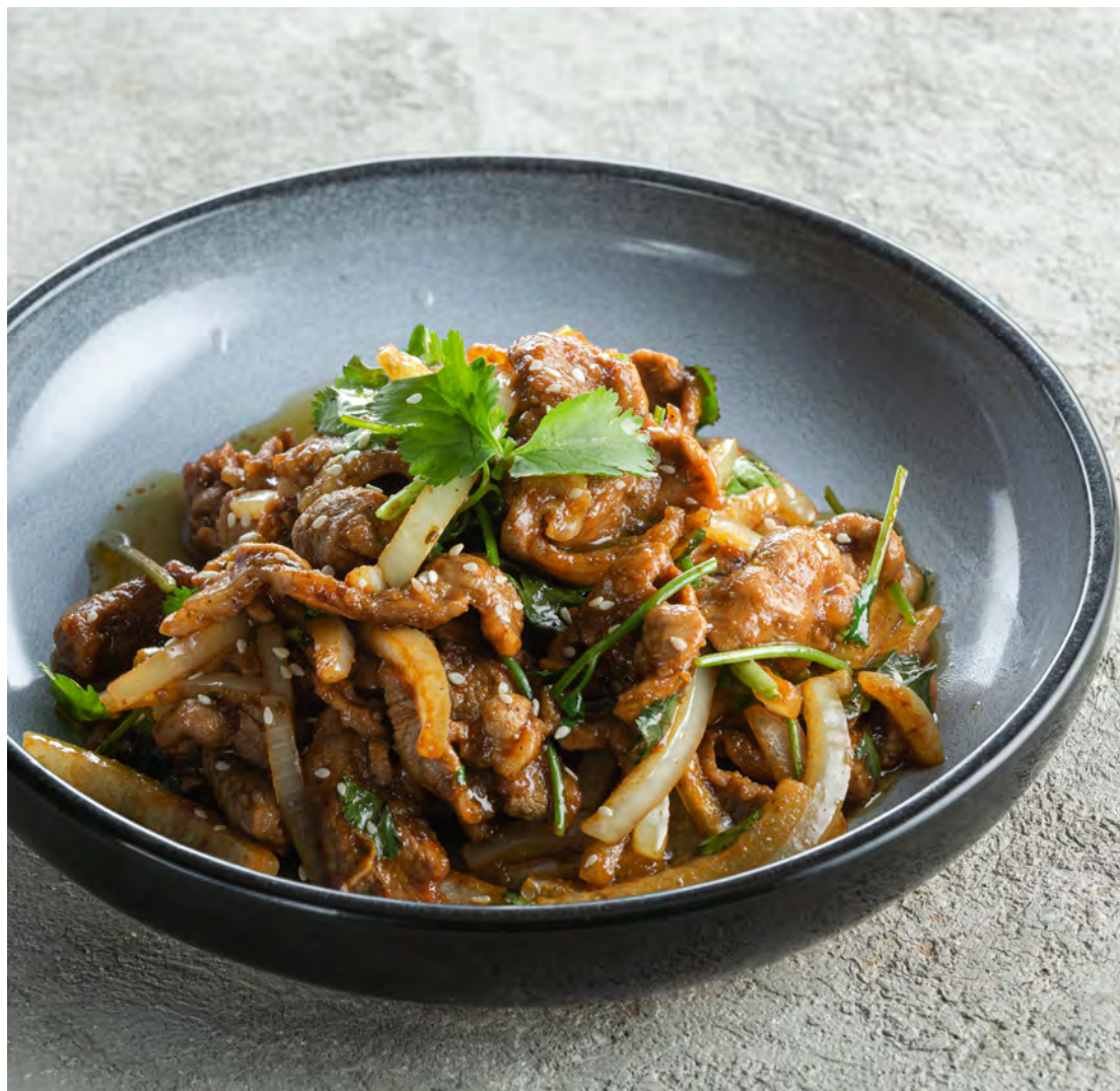
Жареная баранина с луком по-шаньдунски 葱爆羊肉 / Lamb and Onion Stir-Fry