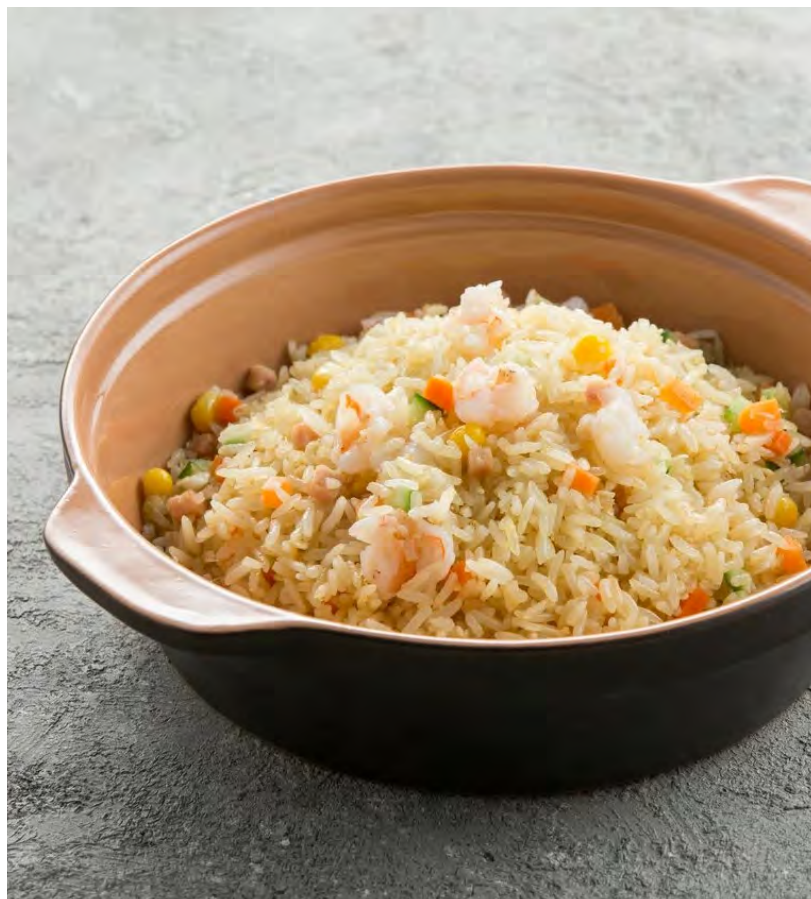
Жареный рис по-янчжоуски 扬州炒饭 / Yangzhou Fried Rice with Vegetables, Ham and Shrimps ..... 350,00