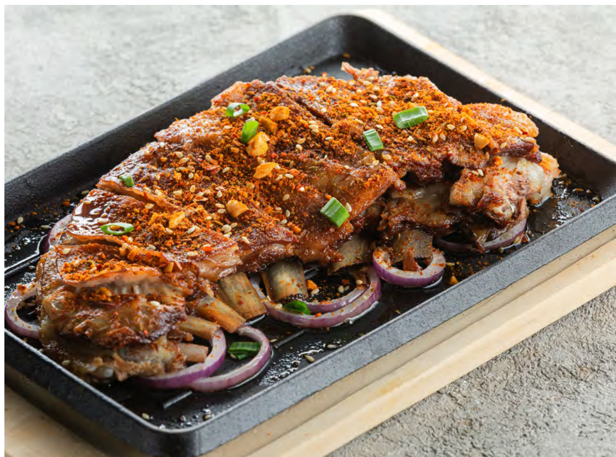
Пряные бараньи ребрышки с луком и кумином 孜然羊排 / Cumin Roasted Lamb Chops