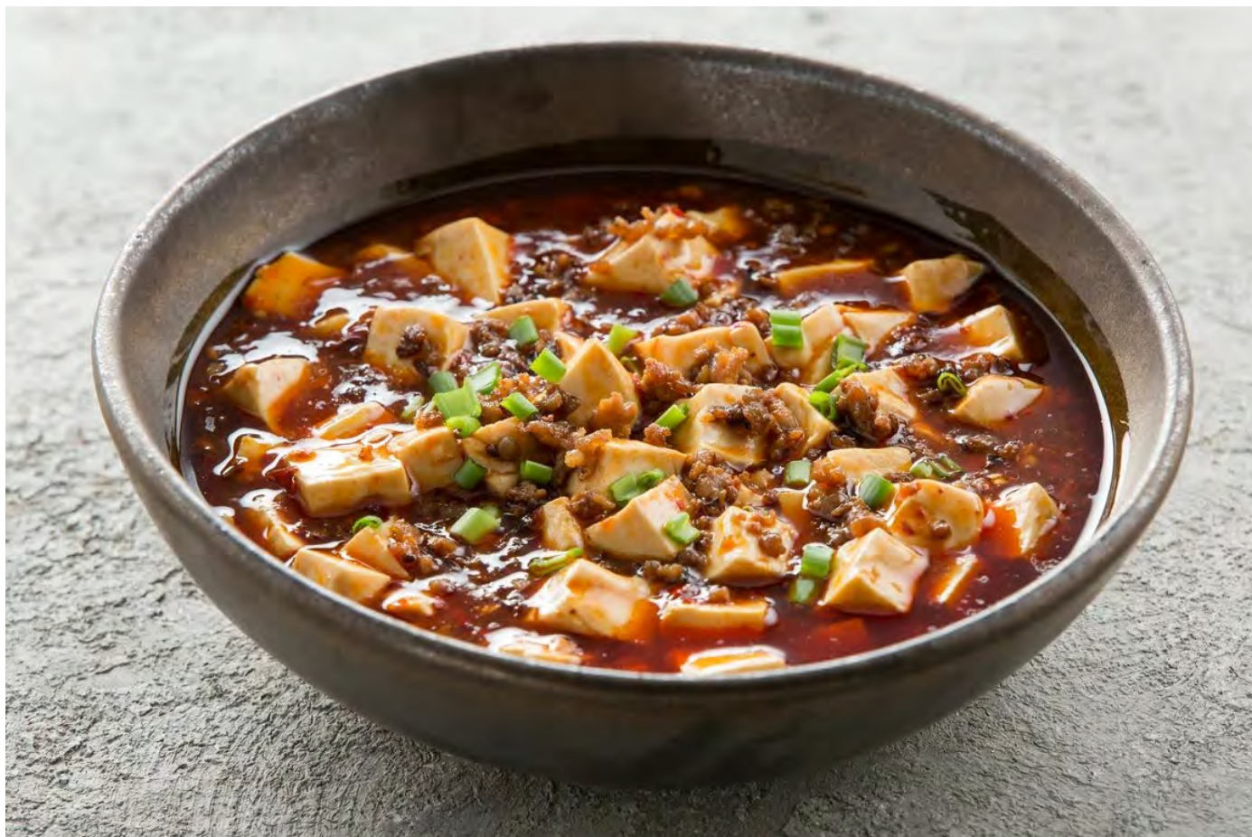
Мапо тофу по-сычуаньски с говяжьим фаршем в остром соусе

麻婆豆腐 / Sichuan Spicy Tofu with Ground Beef ..... 520,00