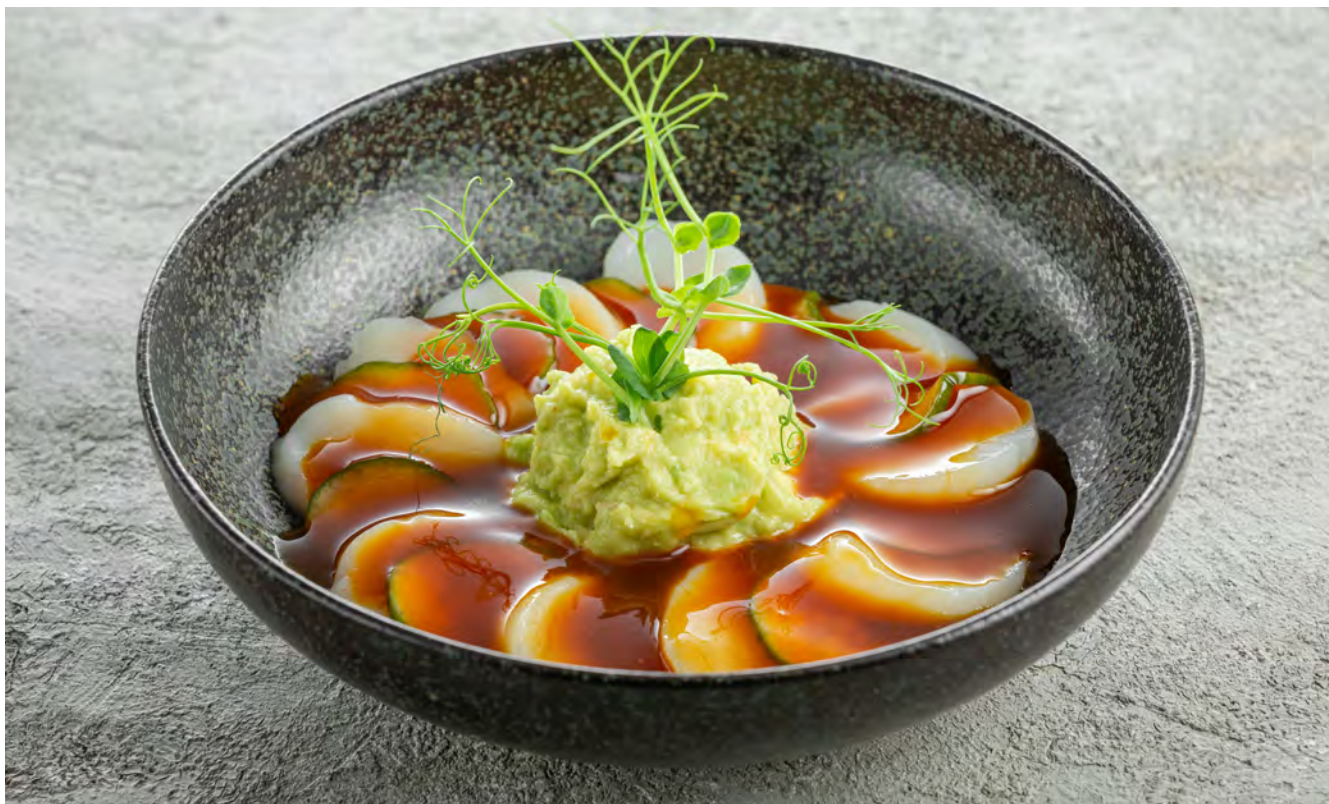
Тирадито из гребешка с авокадо и соусом понзу