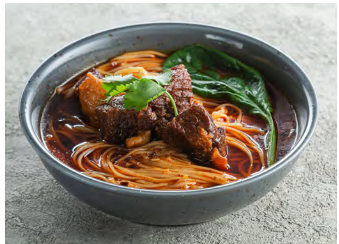
Пшеничная лапша с говядиной "Хуншао" в бульоне 红烧牛肉面 / Hangshao Beef Noodles ..... 390,00