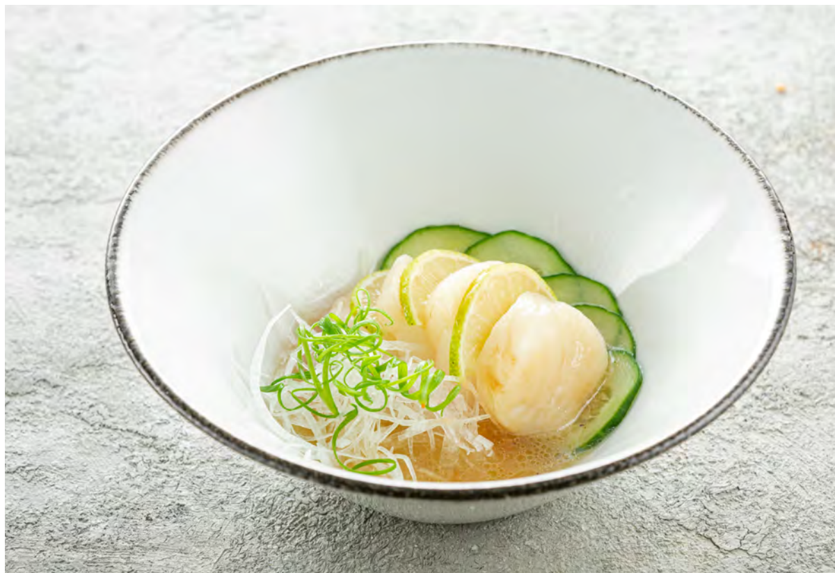
Сашими гребешок 扇贝刺身 / Scallop Sashimi ..... 390,00