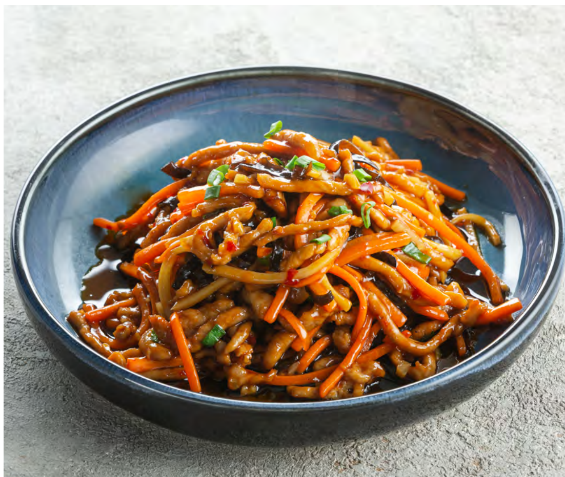
Свинина "Юйсян" в остро-сладком соусе 鱼香肉丝 / Yu Xiang Shredded Pork in Sweet and Spicy Sauce ..... 530,00