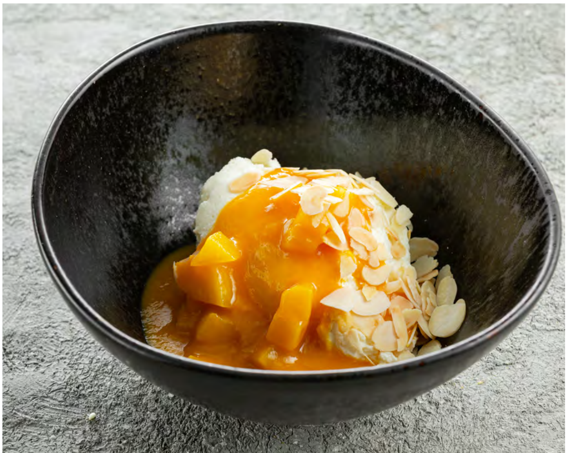
Чизкейк из белого шоколада с ананасовым конфи