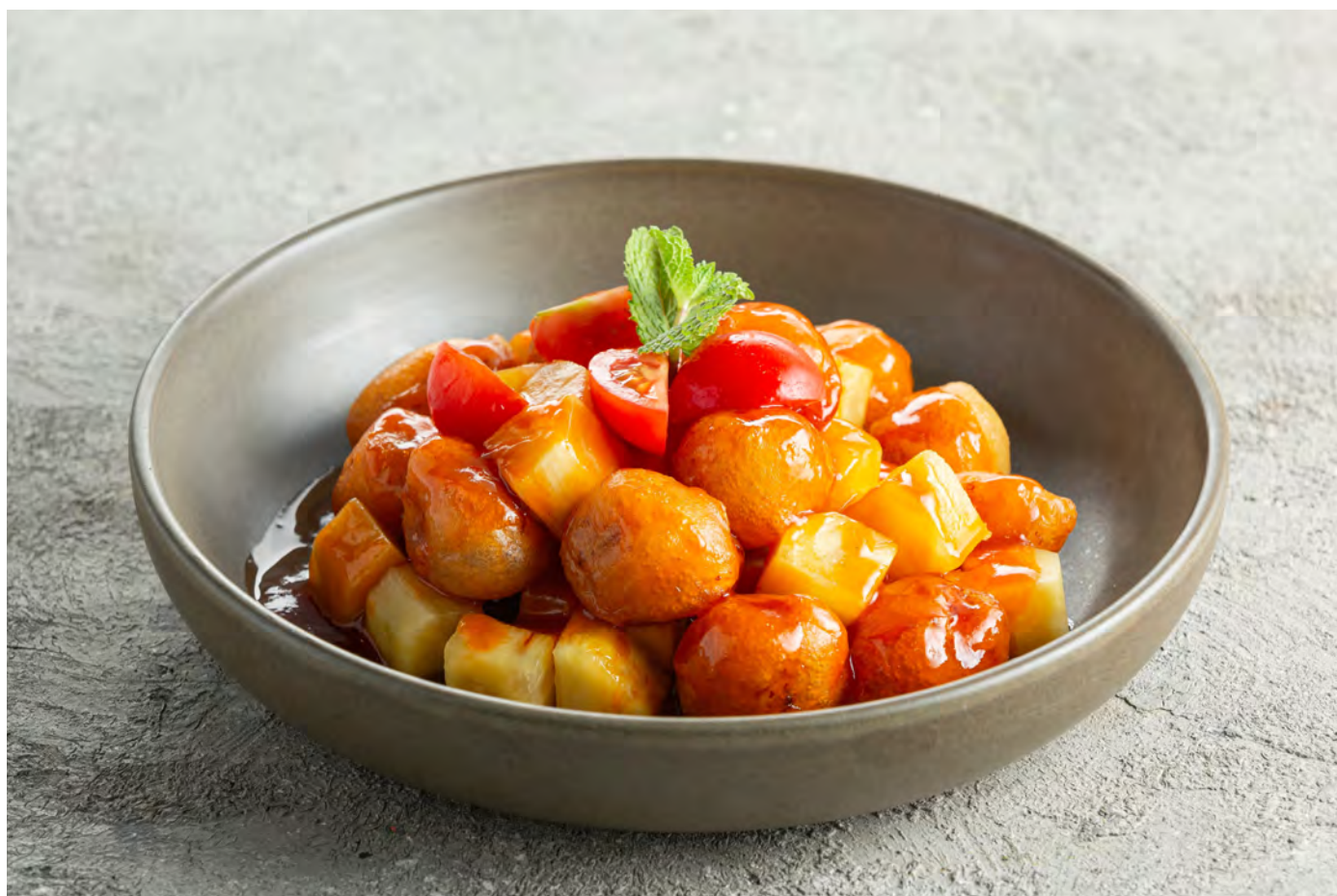
Свинина в кляре под кисло-сладким соусом с ананасом 菠萝咕咾肉 / Sweet and Sour Pineapple Pork