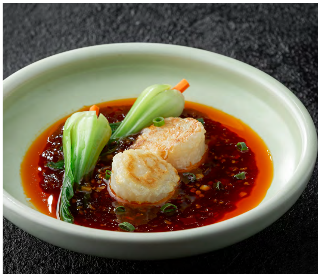
Обжаренный гребешок в остро-сладком соусе "Юйсян"

菠萝海鲜饭 / Pineapple Shrimp and Squid Fried Rice ..... 650,00