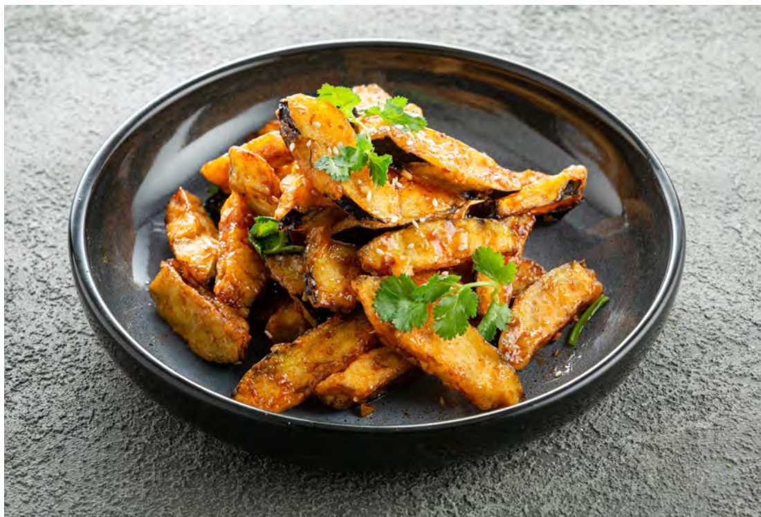
Карамелизированные баклажаны 脆皮茄子 / Deep Fried Eggplant ..... 500,00