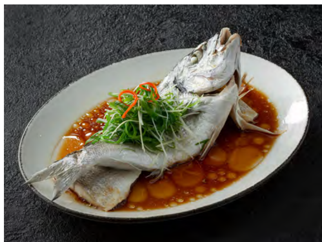
Дорадо на пару 清蒸金头鲷 / Steamed Dorado ..... 860,00