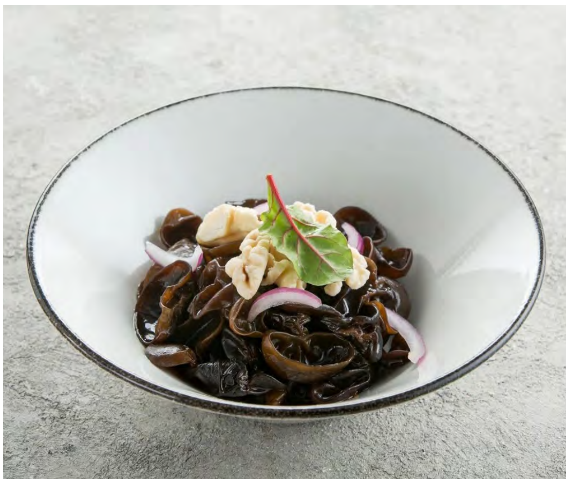
Черные древесные грибы с грецким орехом 木耳拌桃仁 / Black Wood Ear Mushroom and Walnut Salad ..... 350,00