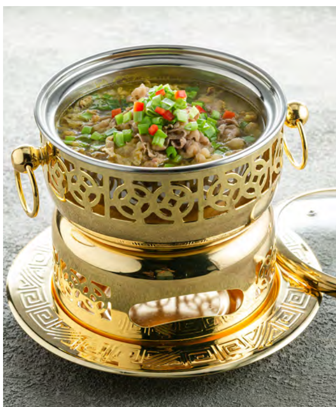
Говядина в кисло-остром бульоне 酸汤肥牛 / Sliced Beef in Sour Soup ..... 760,00