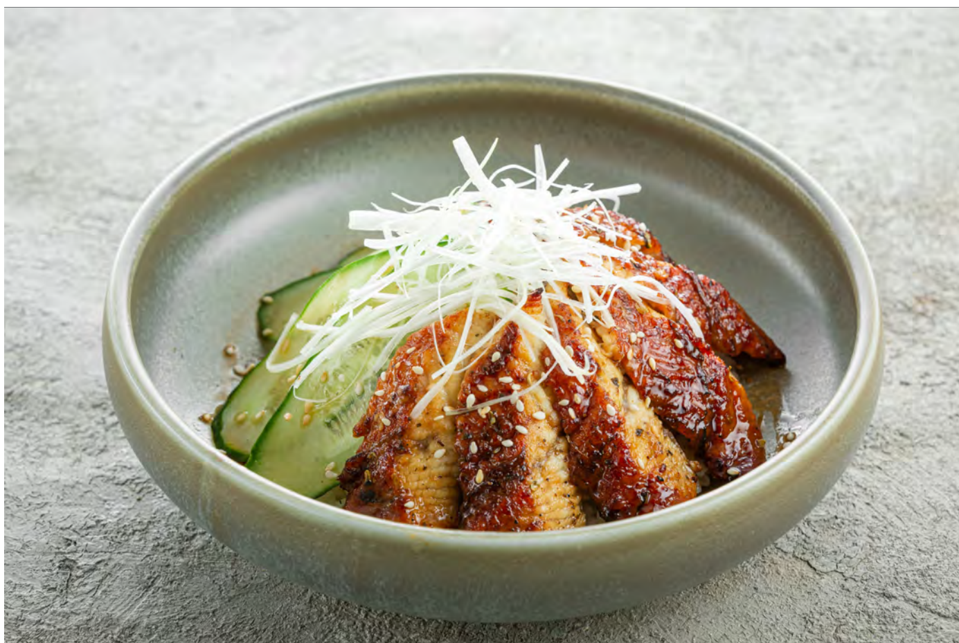
Угорь Кабаяки 蒲烧鳗鱼饭 / Kabayaki Eel ..... 650,00