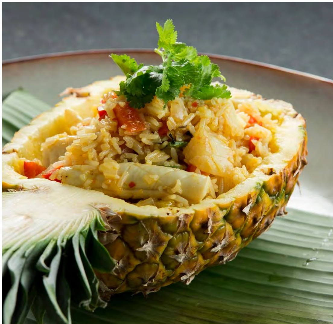
Рис с кальмаром и креветками в ананасе

菠萝海鲜饭 / Pineapple Shrimp and Squid Fried Rice ..... 650,00