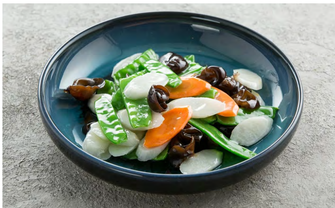
Стир-фрай из сахарного горошка, древесных грибов и ямса 田园小炒 / Snow Peas, Wood Ear Mushrooms and Chinese Yam Stir-Fry ..... 530,00