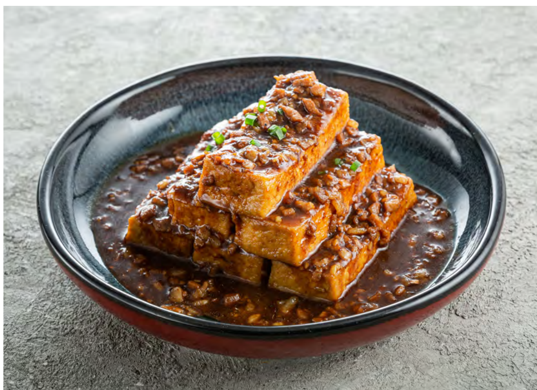
Жареный тофу "Хуншао" с соусом из свиного фарша и степных вешенок

红烧豆腐 / Hongshao Tofu with King Oyster Mushroom and Ground Pork Sauce ..... 440,00