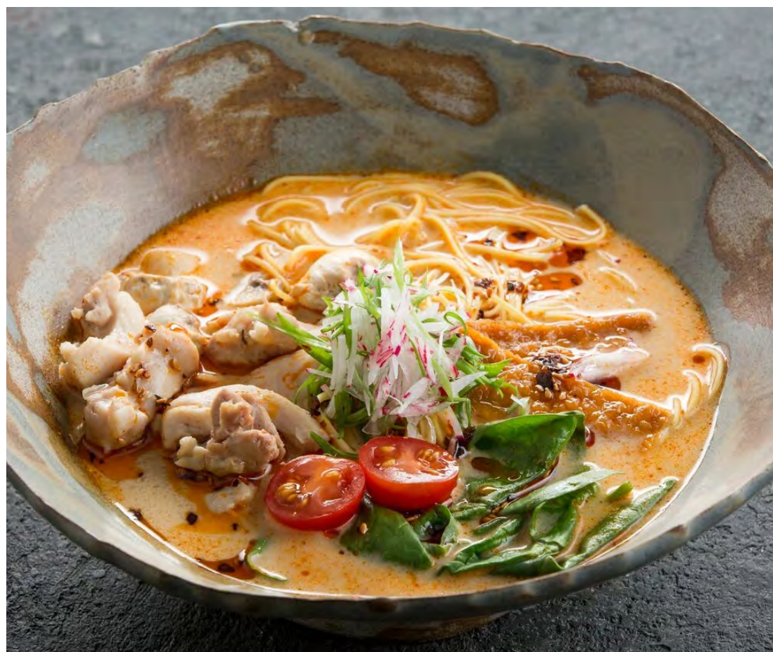
Лакса по-сингапурски с цыпленком 新加坡鸡肉加沙面 / Singapore Style Laksa with Chicken..... 430,00