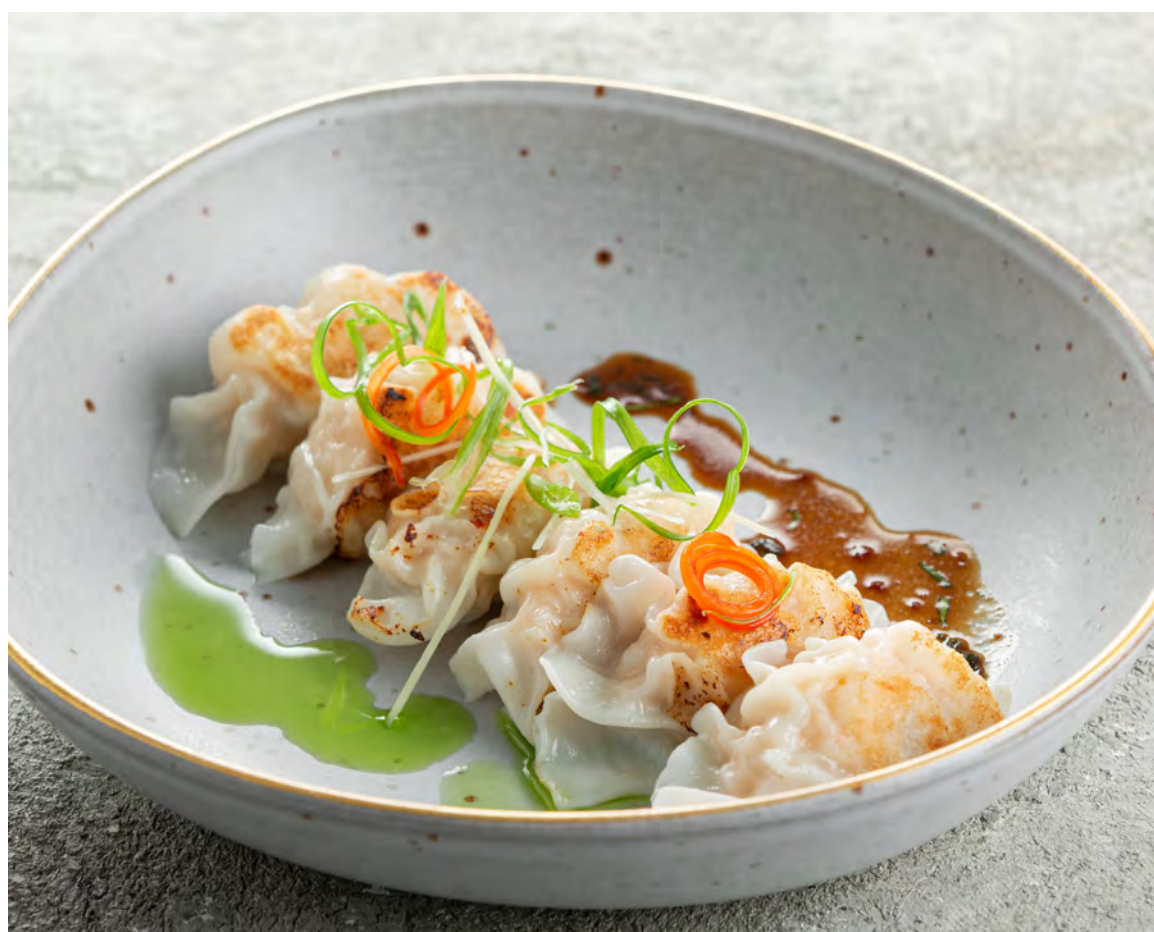
Гедза с креветками 鲜虾日式煎饺子 / Shrimp Gyoza ..... 560,00