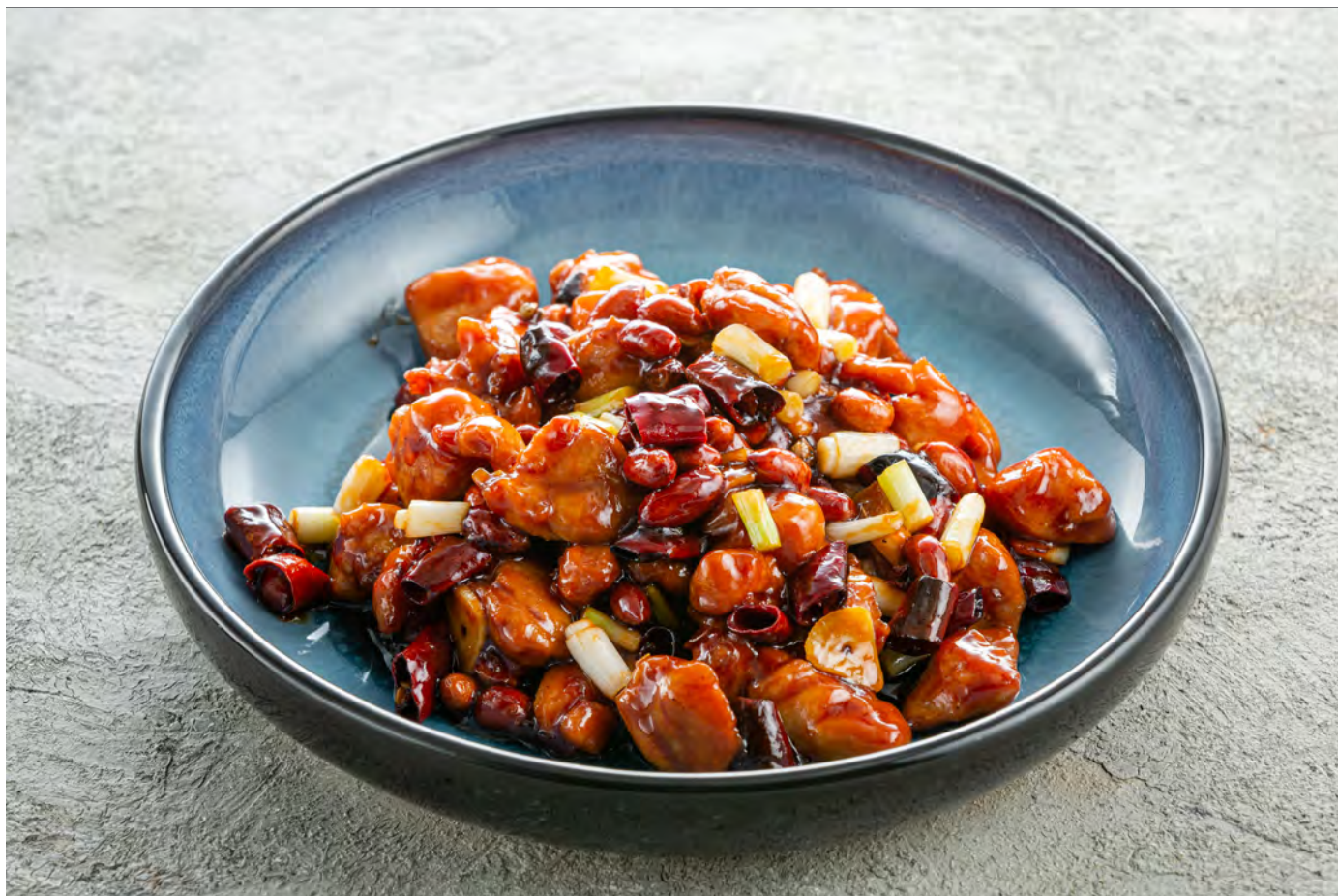
Цыпленок "Гунбао" 宫保鸡丁 / Kung Pao Chicken ..... 530,00