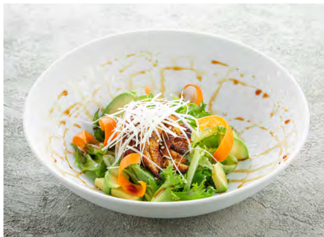
Салат с угрем и гуакамолем из черного авокадо 鳗鱼沙拉配鳄梨酱 / Eel Salad with Avocado ..... 750,00