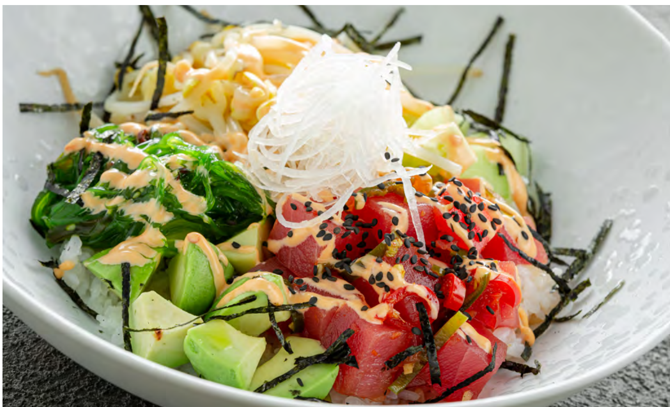
Поке с тунцом и соусом Аджи Майо

夏威夷金枪鱼盖板配阿马里洛辣椒蛋黄酱 / Tuna Poke with Aji Amarillo Sauce