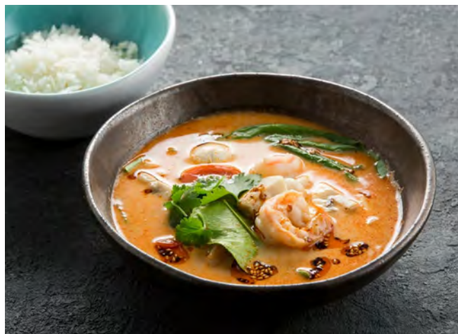
Том Ям Кунг с креветками 鲜虾冬阴功汤 / Tom Yum Kung with Shrimp..... 540,00