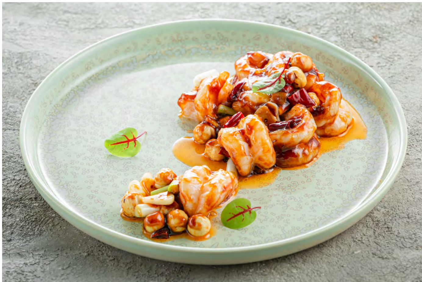
Креветки "Гунбао" в остро-сладком соусе с фундуком 宫保虾球 / Kong Pao Shrimp