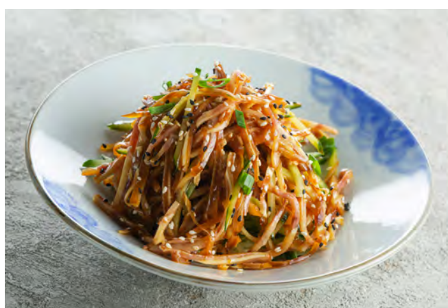
Битые огурцы с чесноком 拍黄瓜 / Smashed Cucumber Salad ..... 330,00