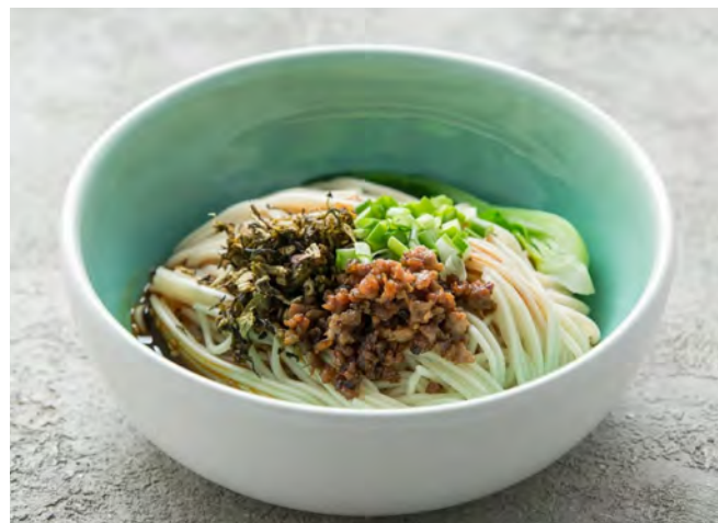
Острая лапша в бульоне по-чунцински 重庆小面 / Chongqing Noodles ..... 390,00